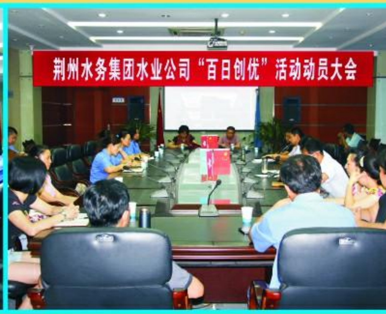
“百日创优”活动动员大会