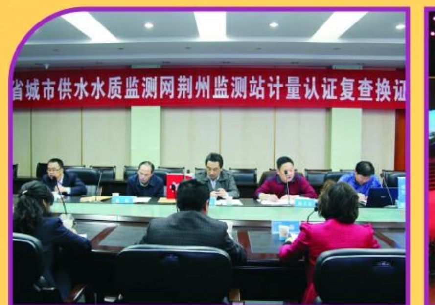
水质计量认证复查