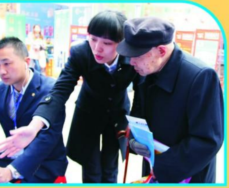
沙隆达广场315活动现场