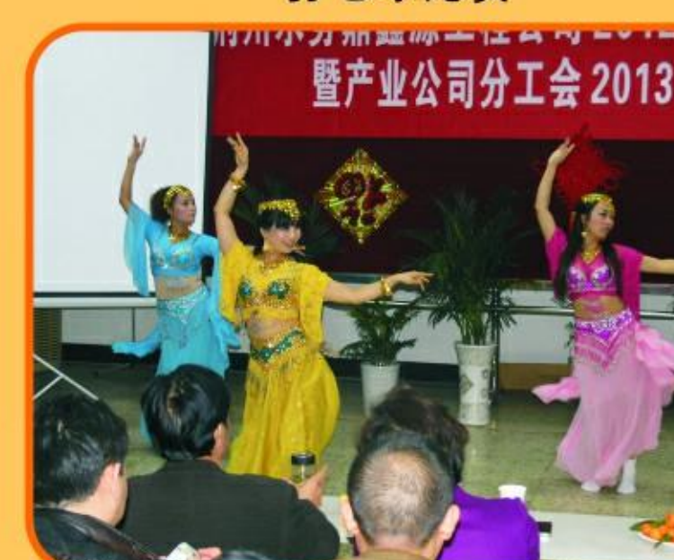
暨产业公司分公司2013迎春