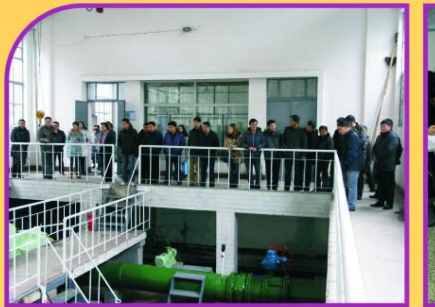
中层干部参观交流