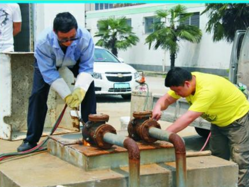
皇冠味品地下水取缔