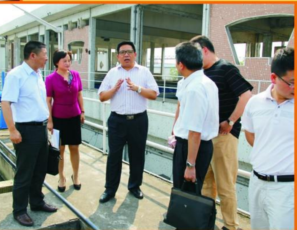
市建委主任张少华调研三个制水厂

企业的发展离不开政府有关领导的关心和支持。一年来，荆州市副市长马秋平、市建委主任张少华、市国资委各级领导都亲临集团公司进行视察调研，在肯定集团公司“安全供水、优质服务”的同时，就强化安全供水、大力开展创先争优、加强饮用水源地保护等项具体工作给出了明确的指导，极大鼓舞了员工的士气，强力助推公司的发展。