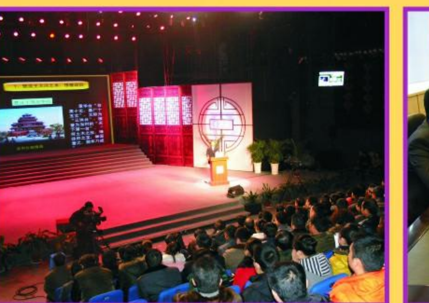
参加“道德讲堂”活动