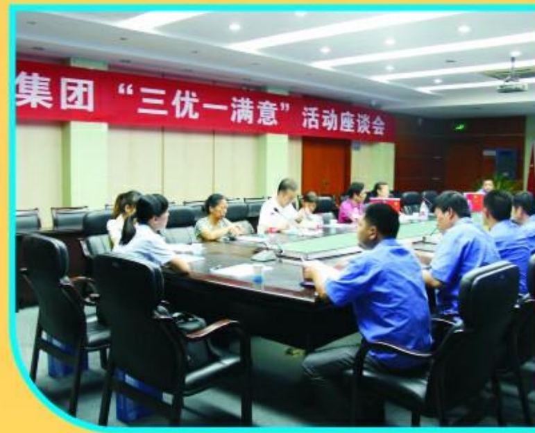
“三优一满意”居民观察团探访水务集团