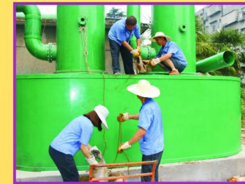
南湖水厂加氯设备改造