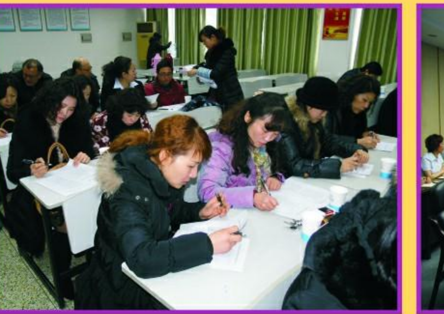
员工参与干部考评