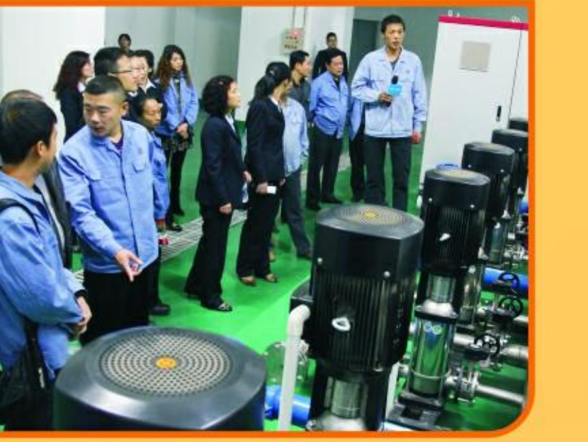
员工交流活动现场