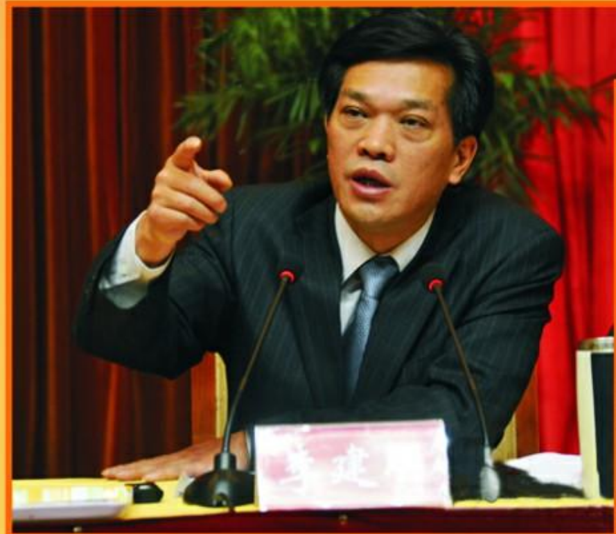
荆州市市长李建国组织召开专题会议，研究饮用水水源保护工作