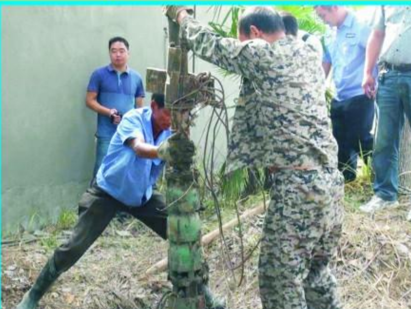
市华升建设有限公司地下水取缔