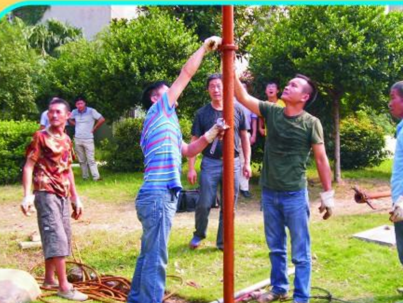
技工学校地下水取缔