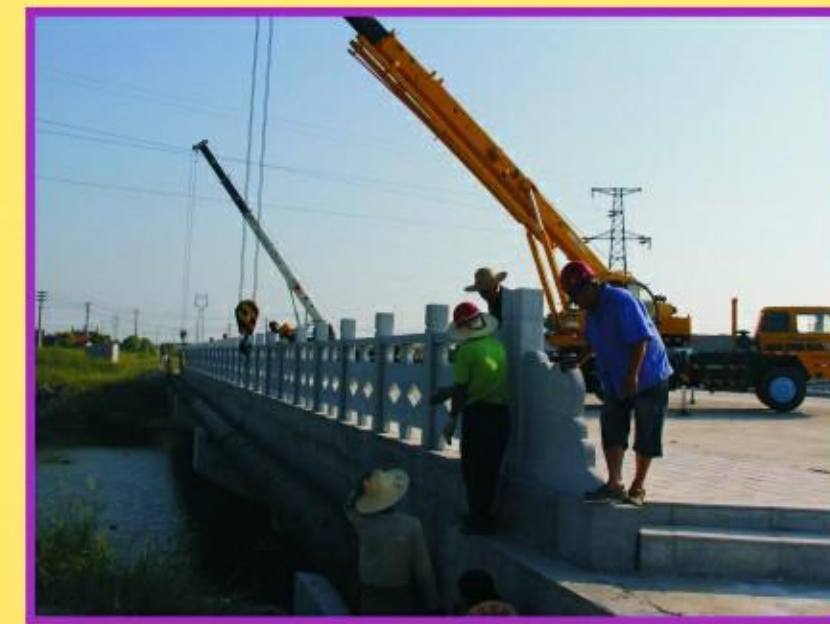
深圳大道施工现场