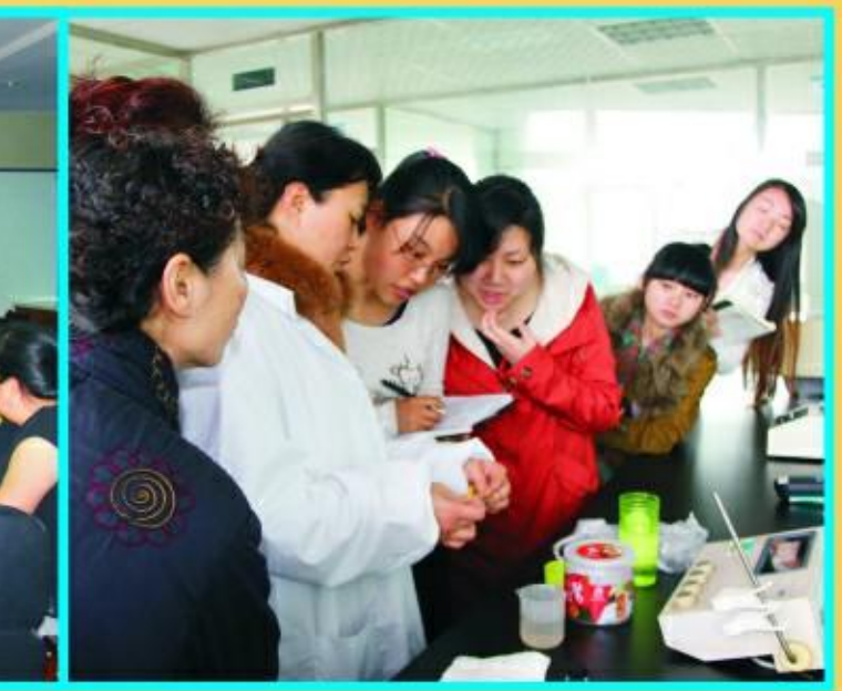
晚报记者和十方庵社区代表走进水厂