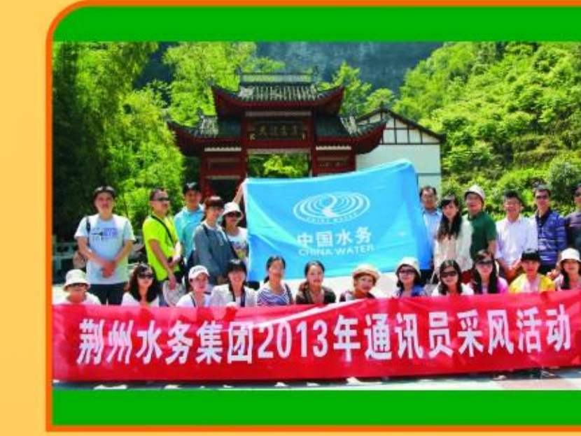
文学协会到宜昌车溪采风