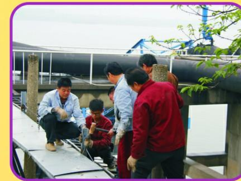
柳林水厂取水泵船配电系统改造